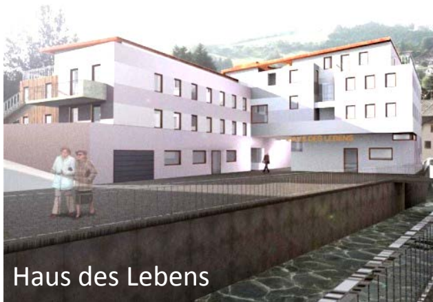
Haus des Lebens